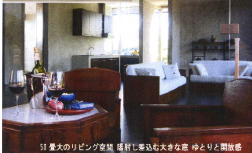
50畳大のリビング空間 陽射し差込む大きな窓 ゆとりと開放感