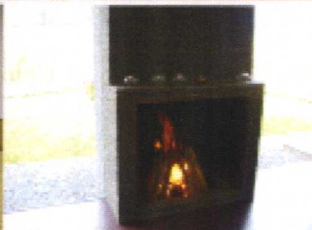
高原リゾートならではの暖炉のある暮らし