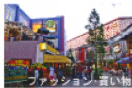
ファッション・買い物