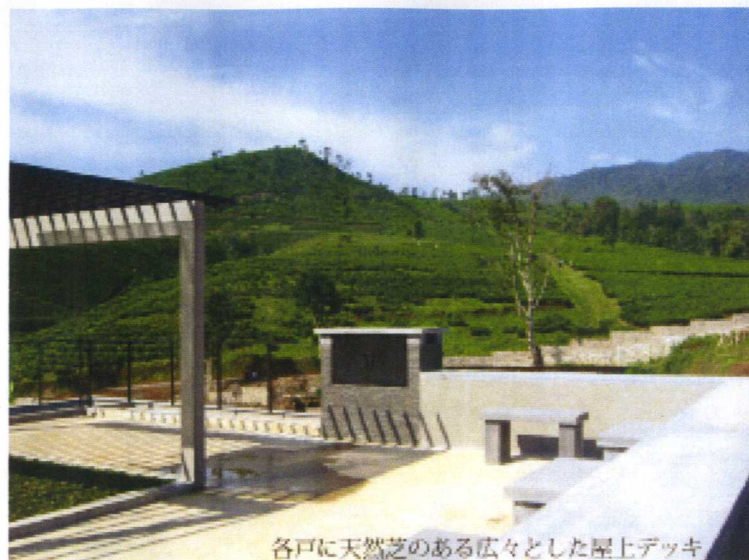
各戸に天然芝のある広々とした屋上デッキ