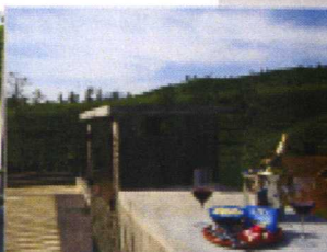
屋上デッキでワイン片手に星空を堪能