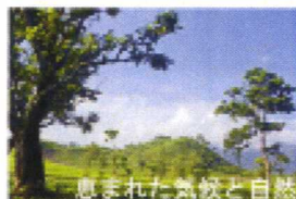
息まれた気候と自然

オランダ統治時代の歴史ある風情を残しつつ、ファッション、大学の街としての都会の活気で賑わう興味深く飽きない街。豊かな自然に囲まれた標高800Mの高原ならではの「1年中が夏の軽井沢」と言われる快適な気候。大型総合病院、日本食スーパーも揃い、便利で安心なインドネシア第3の都市、だからロングステイに最適です。