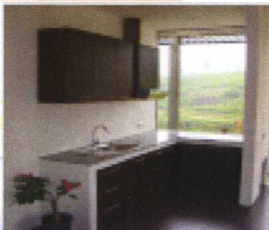
食器・調理器具付の広々としたシステムキッチン 眺めも抜群